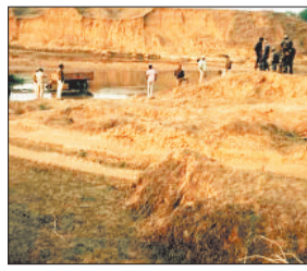
रेत से भरा वाहन जब्त, नियमों के तहत प्रकरण दर्ज

जशपुरनगर। अवैध रेत खनन व परिवहन के संदर्भ में प्राप्त शिकायत पर प्रशासन ने त्वरित जांच कर दोस कार्रवाई की है। सहायक खनि अधिकारी ने बताया कि, जांच के दौरान ग्राम भुडकेला, तहसील जशपुर में वाहन क्रमोंक सीजी 14 एमजी 1390 से अवैध रूप से रेत परिवहन किया जाना पाया गया। इस पर तत्काल कार्रवाई करते हुए वाहन को जब्त किया गया तथा खान और खनिज अधिनियम 1957 की धारा 21 के तहत प्रकरण दर्ज कर विधिमत कार्रवाई प्रारंभ कर दी गई है। खनिज अधिकारी ने बताया कि, तहसील फरसाबहार क्षेत्र में ईब नदी से अवैध रेत उत्खनन, परिवहन एवं भंडारण की जांच के दौरान पूर्व में 9 फरवरी 2026 को ईब नदी से निकाली गई 960 घनमीटर रेत अमय कंस्ट्रक्शन, जशपुर से जब्त की गई थी। इस मामले में भी अधिनियम की धारा 21 के अंतर्गत प्रकरण दर्ज कर नियमानुसार कार्रवाई की जा रही है। उल्लेखनीय है कि, तहसील फरसाबहार अंतर्गत ईब नदी पर ग्राम बलुवाबहार में वैध रेत खदान स्वीकृत है। इसके अतिरिक्त अवैध उत्खनन पर रोक लगाने एवं सुव्यवस्थित खनन व्यवस्था सुनिश्चित करने हेतु ग्राम दाईनबहार 1 हेक्टेयर, ग्राम खारीबहार 4 हेक्टेयर तथा ग्राम बरकसपाली 1 हेक्टेयर को रेत खदान घोषित कर निविदा आमंत्रण की प्रक्रिया प्रारंभ की गई है।